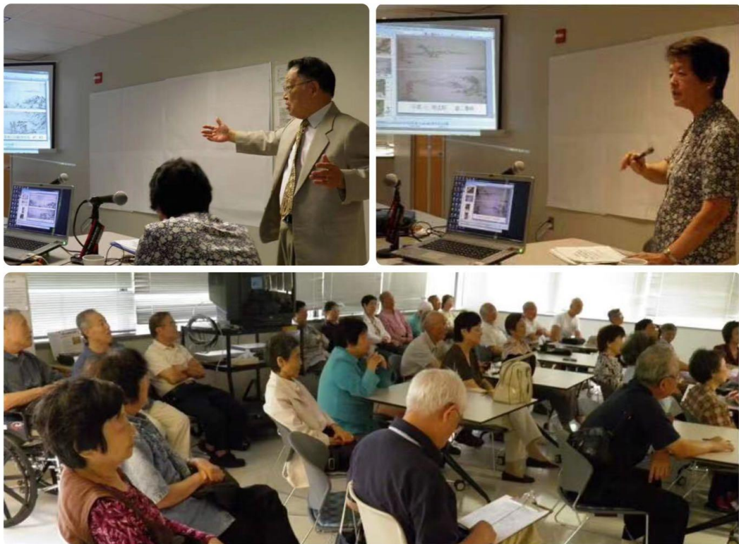
二位老师图文并茂，深入浅出介绍欣赏诗画要点，分享诗情画意，听众聚精会神。