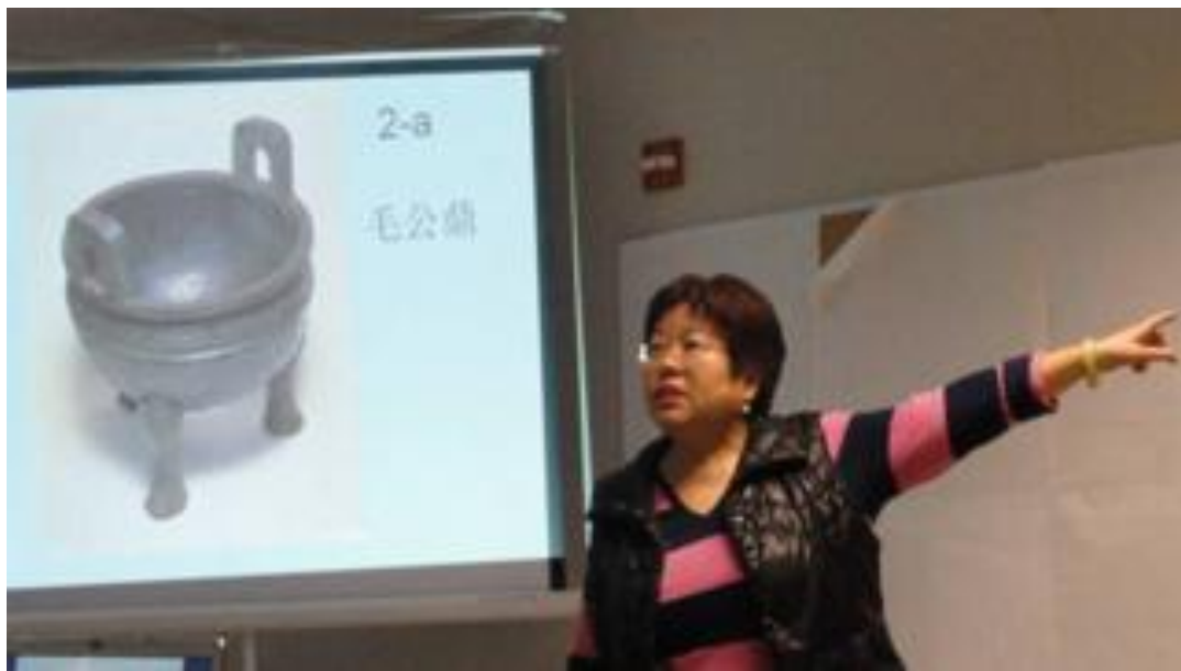
我国早期出现的青铜大型祭祀用的毛公鼎介绍