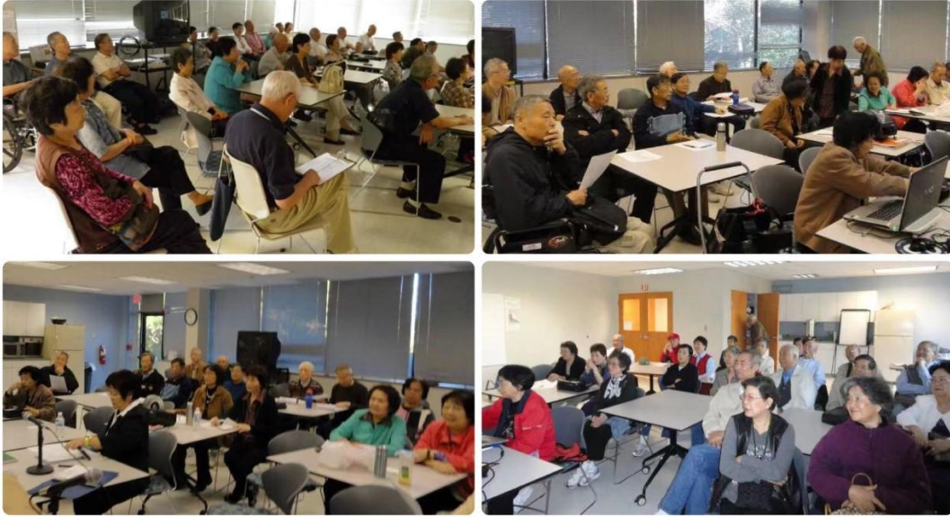
杨老师的 4 次国宝系列《中外国宝痴迷狂》讲座通常座无虚席