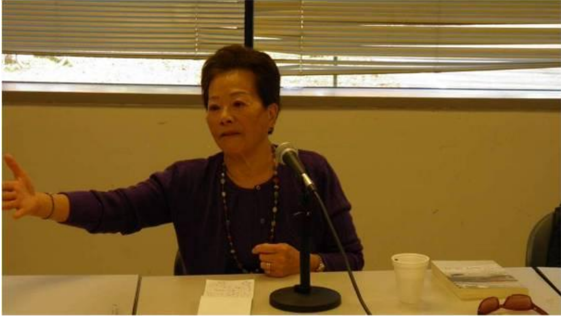
於梨华女士在讲座会上