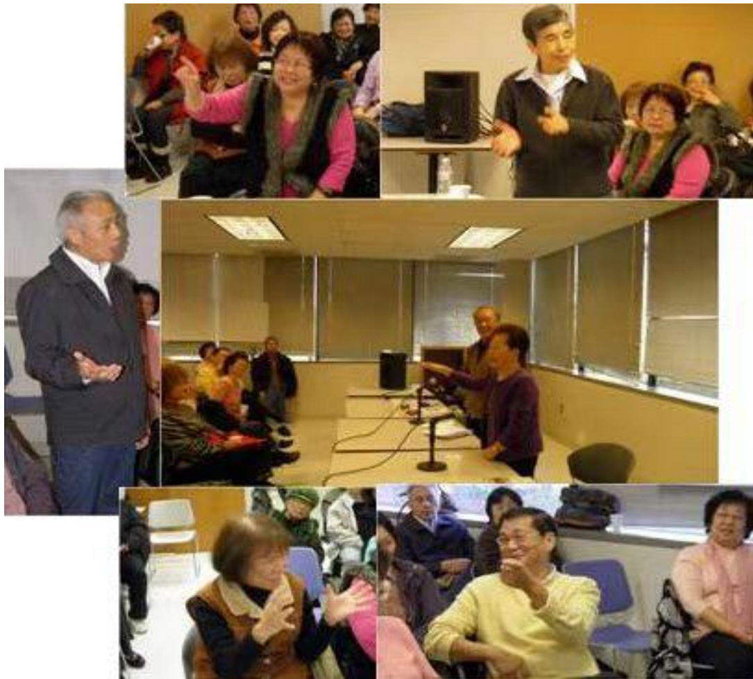
热烈讨论交流的银光会员们