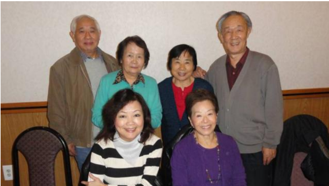
前排右一於梨华作家，后排左面欧阳-余传禧老师，后排右面柏胤庆-吴影老师